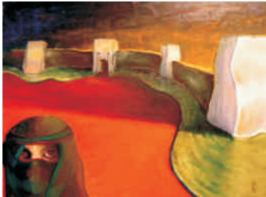
Emilio Dettori (Italien)