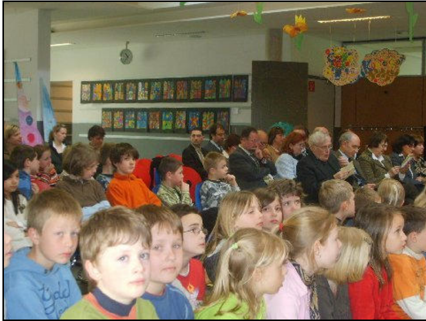
Pubblico in sala