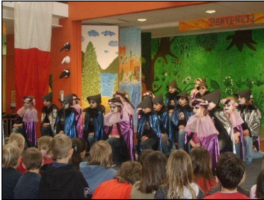
Ballo cantato - bambini della Diesterwegschule