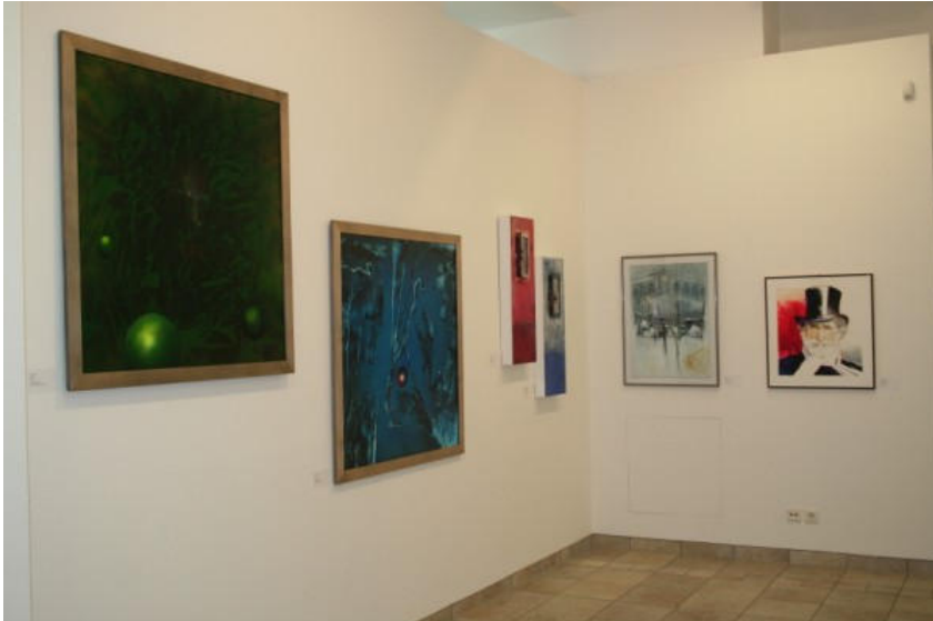
Momenti della mostra