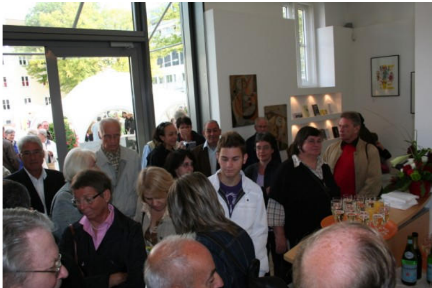
Alcuni visitatori della mostra