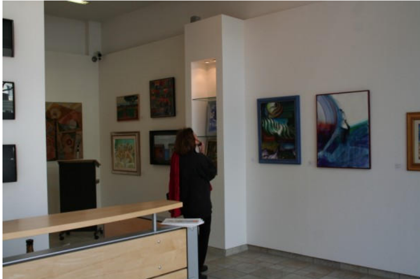
Momenti della mostra