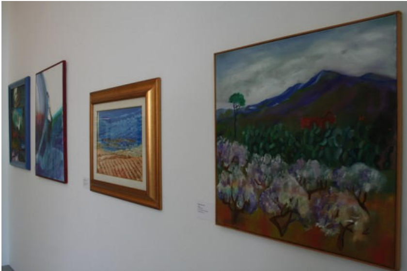
Momenti della mostra