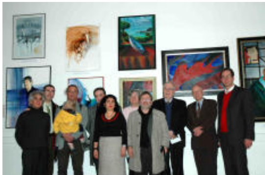
Alcuni artisti con le Autorità

Meglio avere due nemici palesi che un falso amico celato.